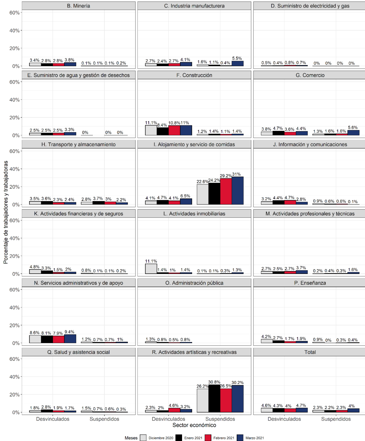
Gráfico 3. Proporción de personas trabajadoras suspendidas y desvinculadas sobre el total del personal contratado. Por sector económico (CIU rev4.c)