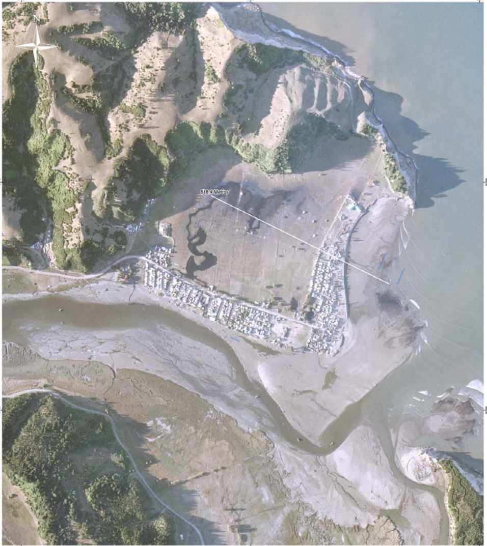
Imagen: SAF DMC 0.5 Metros