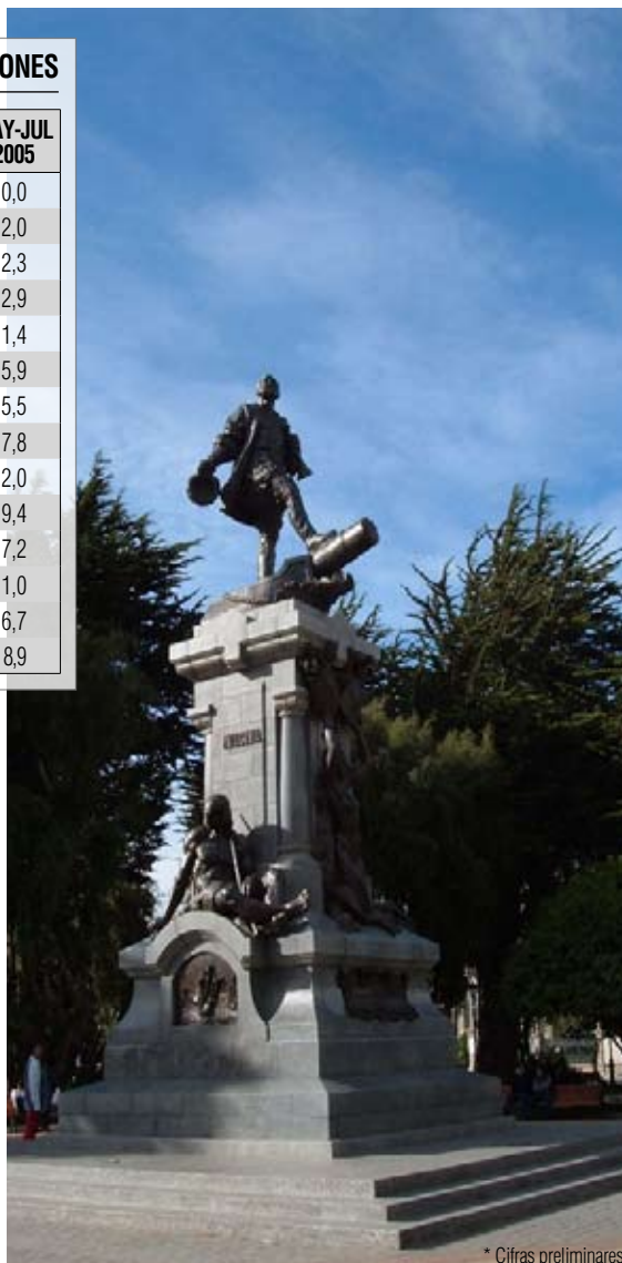
* Cifras preliminares

En la población de 25 a 54 años se concentra el 72,3% de la fuerza de trabajo, con una tasa de desocupación global de 7,6%.