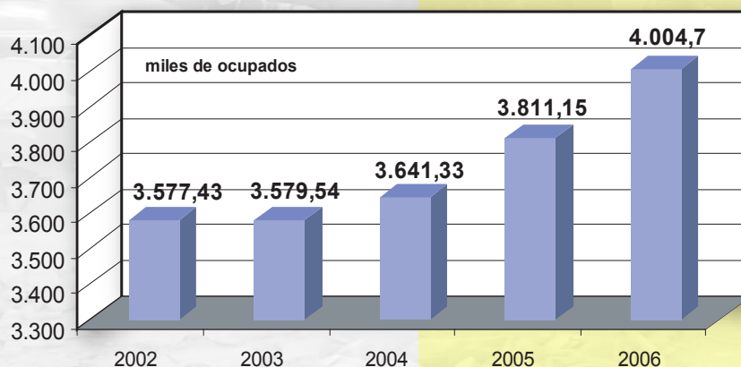
Trabajadores Asalariados (trimestre Ene-Mar de cada año)

El empleo de hombres y mujeres creció en 12 meses a tasas de 3,0% y 3,3%, respectivamente.